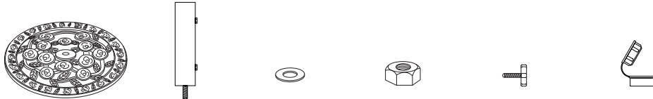
A.ベース：1枚 B.ポール：1本 C.ワッシャー：1枚 D.ナット：1個 E.固定ボルト：2本 F.アダプター：1個