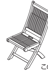
この商品は完成品です。