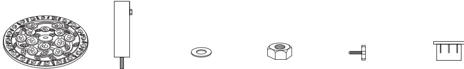
A.ベース：1枚 B.ポール：1本 C.ワッシャー：1枚 D.ナット：1個 E.固定ボルト：1本 F.アダプター：1個