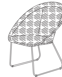
この商品は完成品です。